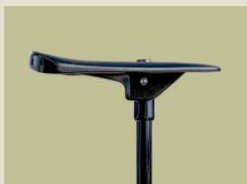
Sitzlänge ca. 23 cm