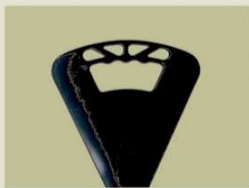
Sitzbreite ca. 20 cm